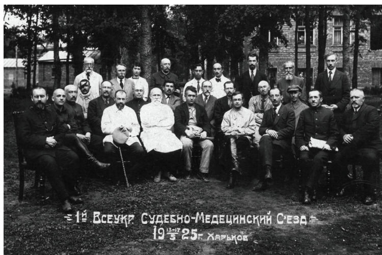
Мал.1. Делегати Першого Всеукраїнського судово-медичного з'їзду у м. Харкові, 1925 р. (в центрі (сидячи у медичному халаті) – Головний судово-медичний інспектор Наркомздрава, Заслужений проф. Микола Сергійович Бокаріус)

Серед архівного матеріалу був знайдений історичний фотодокумент - оригінальна фотографія 1925 року, яка наочно демонструє факт проведення Першого Всеукраїнського судово-медичного з'їзду у м. Харкові (мал. 1).