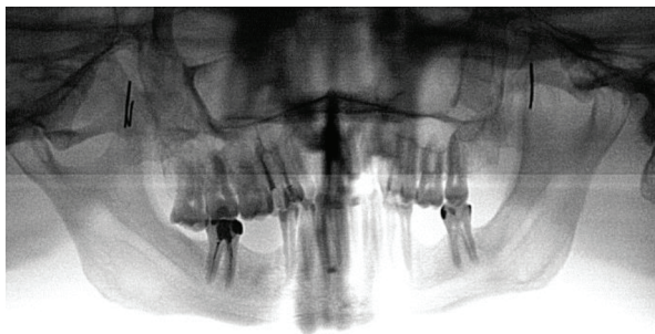
Рис. 3. Остаточна ортопантомограма досліджуваного черепа