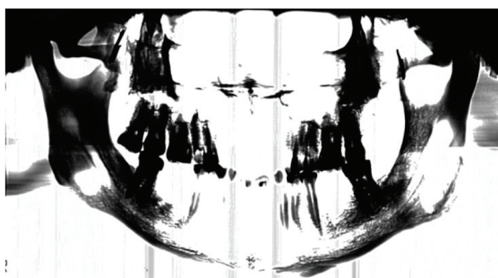
Рис. 2. Ортопантомограма досліджуваного черепа

Для проведення порівняння була зроблена ортопантомограма досліджуваного черепа (рис. 2).